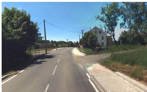
Silnice s propustkem