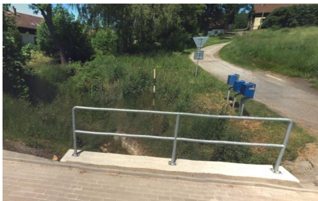
Propustek pod silnicí

Ohrožení zvýšenými průtoky z extravilánu. Propustek drobného vodního toku pod silnicí.